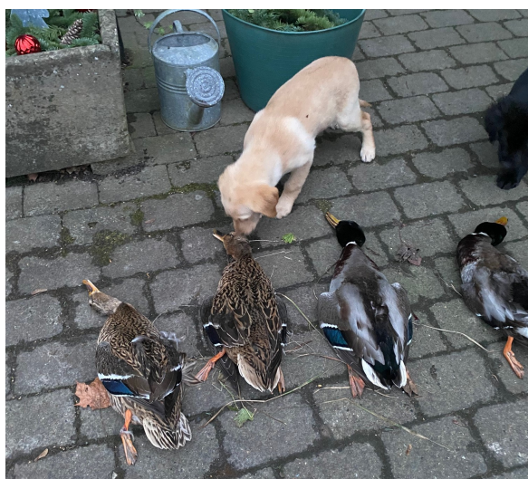
De ænder er lidt farlige

Vi udarbejder retningslinjer til brug ved træningen, hvis vi stadig er ramt af CORONA, når træningen starter den 21. marts.