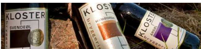
Ølsmagning med besøg fra Klosterbryggeriet