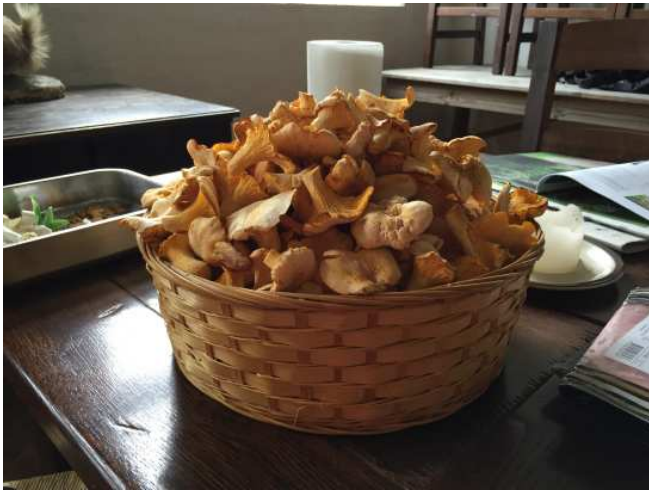
Høst af kantareller i Sverige i sommerferien 2016