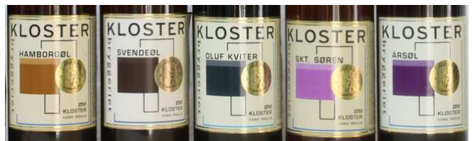
Ølsmagning med besøg fra Klosterbryggeriet