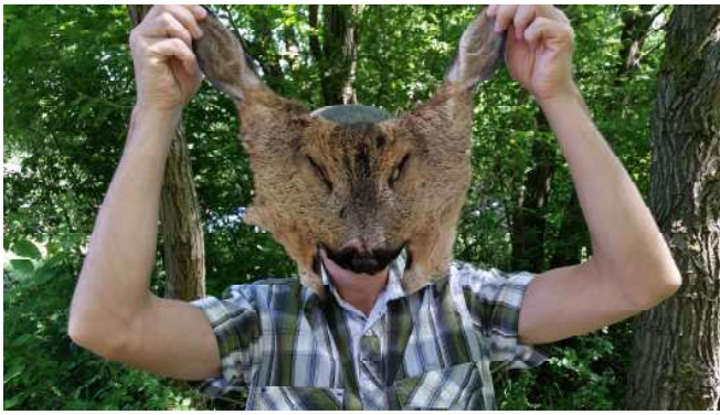
Hvem gemmer sig bag skindet ?