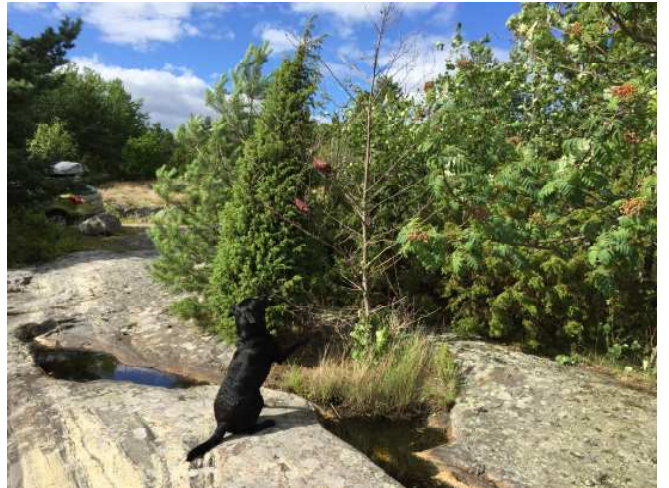
Hvorfor hænger mine dummyer oppe i træet ?