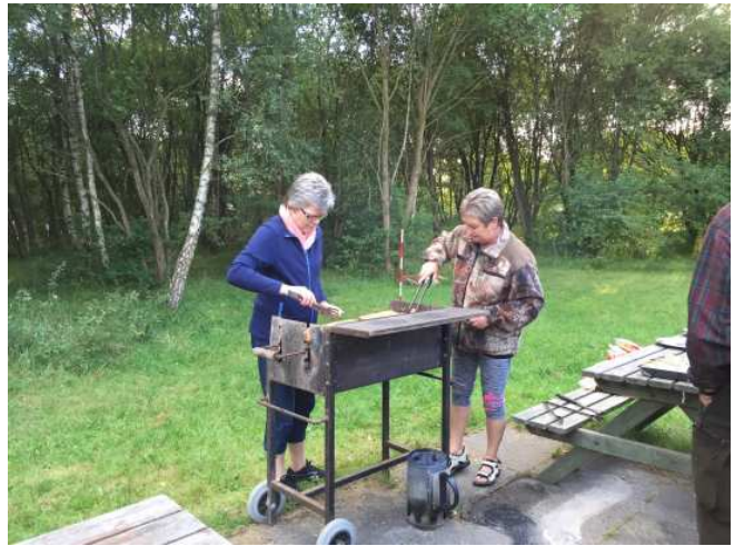
Der grilles pølser til deltagere og hjælpere ved rapporteringsprøven