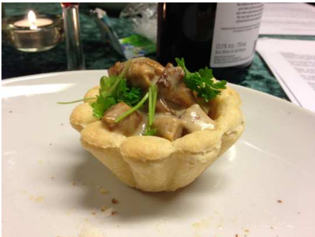
Tarteletter med kantareller til vildt og mad