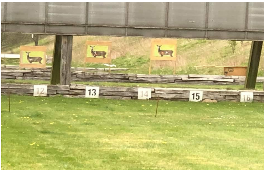
Fra kommunal feltskydningen 2024