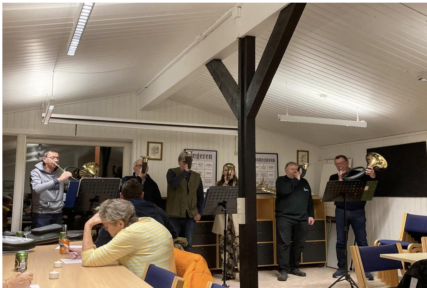
Fra Gløgg og Hornmusik

Vil du lære at blæse jagthorn så er chancen for det her i foreningen vi er en gruppe der blæser hver tirsdag og der kommer jævnlig nye til der gerne vil lære den dejlige kunst at kunne blæse over vildtet på ens jagter i konsortier. Samt til festlige lejligheder. Har du ikke et horn selv i starten så finder vi nok ud af det alligevel foreningen råder over et par horn som kan lånes indtil du selv anskaffer dig et.